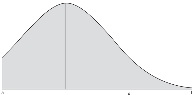
Gráfica 0.2 Distribución normal

En un segundo ejemplo, para calcular valores de integrales definidas usamos el teorema fundamental del cálculo (TFC), el cual nos permite relacionar las antiderivadas de la función con el valor de la integral, sin embargo, hay situaciones en las cuales estas antiderivadas no se pueden expresar como combinación de funciones elementales (las comúnmente conocidas); uno de estos casos se presenta al buscar la probabilidad de una variable aleatoria que tenga una distribución normal, ya que para esto nos vemos enfrentados a calcular la integral definida \int_a^b e^{-x^2} dx y, por tanto, se necesita una antiderivada de la función e^{-x^2} , la cual no puede ser expresada por medio de funciones polinómicas, radicales, exponenciales, logarítmicas ni una combinación de ellas mediante el álgebra de funciones. Aunque el problema claramente tiene solución, dado que es el área bajo la curva de una función continua sobre un intervalo acotado (Apostol, 1996), lo cual gráficamente es